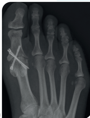
Deze botuiteinden groeien uiteindelijk aan elkaar vast

Doorgaans wordt u op de dag van de operatie opgenomen en blijft u één nacht in het ziekenhuis. De MTP1 artrodese operatie is een ingreep waarbij het gewricht tussen de voet en de grote teen wordt vastgezet. Dit kan zowel door middel van een plaatje en schroeven of alleen met schroeven.