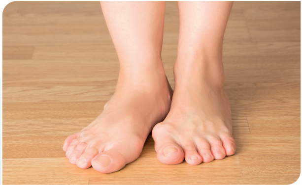
Forse hallux valgus