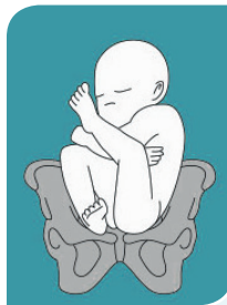
half onvolkomen stuitligging