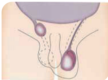
figuur 2: pendelbal